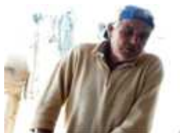
Figuras 15 e 16: Maricultura em Santa Catarina III