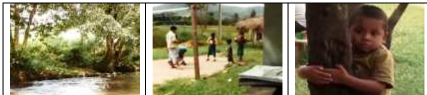
Figuras 7, 8 e 9: Revitalizando Cultura

Segundo Flores, Lopes e Caetano (2010, p. 91), “Nessa produção audiovisual, o caráter documental e artístico se adéqua ao próprio ambiente de pesquisa. As várias possibilidades de significações geradas estão de acordo com o próprio ambiente”.