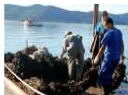
Figuras 10, 11, 12, 13 e 14: Maricultura em Santa Catarina II