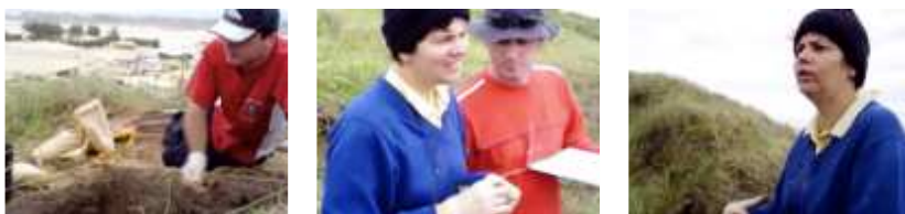
Figuras 1, 2 e 3: Patrimônio Histórico e Cultural

Seguem alguns exemplos desse tipo de produção: